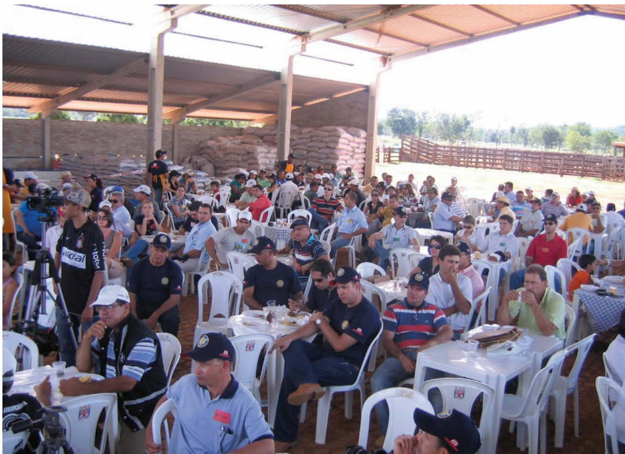
Dia de campo da Paredão atrai dezenas de pecuarista da região

Como na seca não chove, o feno se apresenta em pé. Já a integração lavoura e pecuária só é possível com sorgo, o que já foi testado e implantado na Paredão baiana.