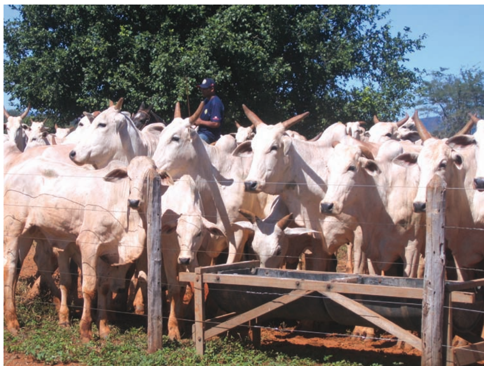
O Nelore da Paredão é uma das grifes da raça