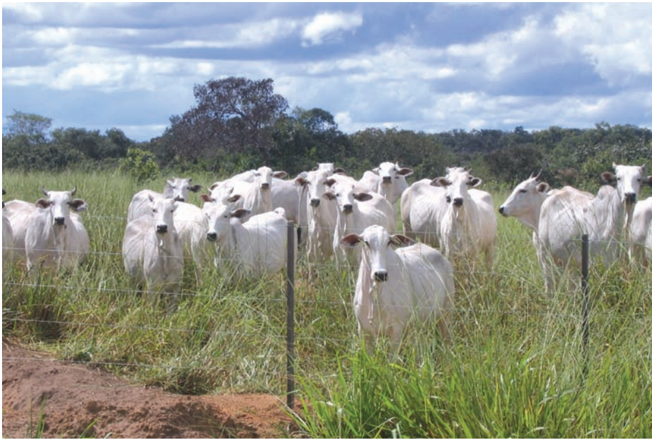
Em quatro anos, a CFM abriu 3,5 mil hectares de pastagens e já produz bezerros para suas unidades de recria

do gado) e a integração lavoura e pecuária. Tanto na agricultura quanto na pecuária de ciclo completo (cria e recria a pasto e terminação em confinamento) utiliza-se protocolos de qualidade e procedimentos como o Qualex e o GlobalGAP, como ferramentas de gestão sustentável, ou seja, além de agregar valor no produto final.