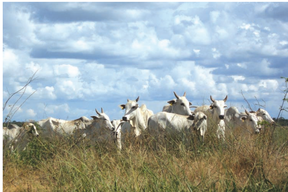
A Agropecuária Jacarezinho chegou na Bahia em 2005

Deste casamento foi formada a família Paranhos Ferreira e da simbiose entre a diplomacia dos Paranhos com a formação agrícola dos Ferreira, prevaleceu a ligação com a terra e tudo que ela pode produzir. Já na atual geração, a pecuária assumiu definitivamente o maior relevo nos ne-