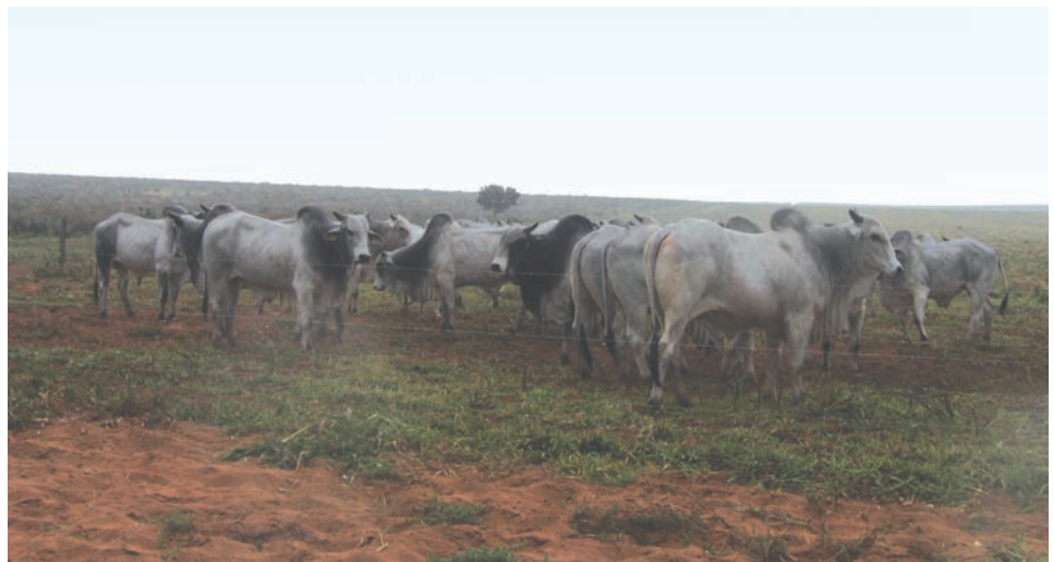
Os touros da CFM são um dos alicerces do projeto pecuário da empresa

O gado Nelore também está em programa de melhoramento genético, o GenSys. Os